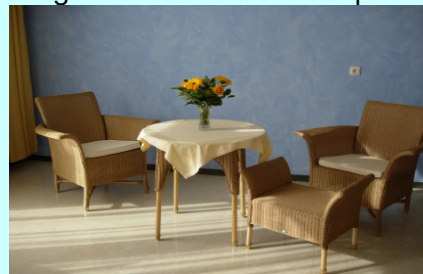
Raum der Stille

Sie umfasst zehn Betten in wohnlichen Einzelzimmern. Auf Wunsch können Angehörige mit übernachten. Es gibt keine feste Besuchszeitenregelung. Das interdisziplinäre Team besteht aus speziell ausgebildeten Ärzten und Pflegepersonal, Sozialarbeitern, Seelsorgern, Physiotherapeuten, Psychoonkologen, Ernährungsberatern, Ehrenamtlichen und vielen Spezialisten unterschiedlicher Fachrichtungen. Im Idealfall kann der Patient wieder in seine gewohnte Umgebung entlassen werden. Wir unterstützen die Vermittlung von ambulanten Hilfen oder auch die Verlegung in ein Pflegeheim oder in ein Hospiz.